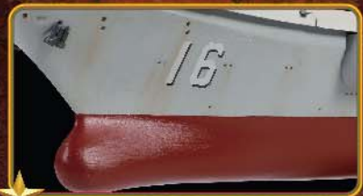
享誉模型界的Forces of Valor的旧化美术效果。