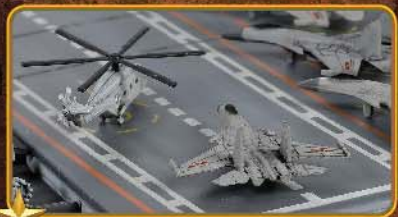
1/700比例精细的舰载机和直升机（表面还刻有线条细节）。