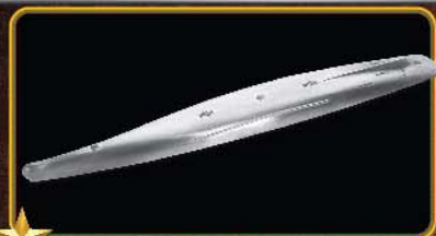
重质感的合金船底。