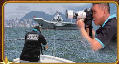
我们的产品是经过丰富的资料研究查阅，高度还原产品真实。