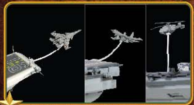
全球首创的舰载机起飞以及降落的动态展示支架。