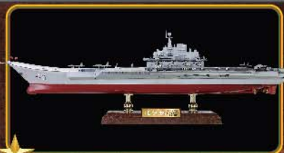
第一种展示模式：把航空母舰放在有合金支柱的仿木纹展示台。