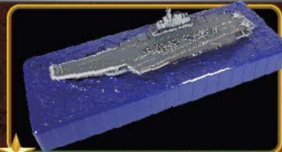
第二种展示模式：把航空母舰安放在高像真度的海浪波纹吸塑内。