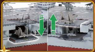
可手动调动甲板升降台。